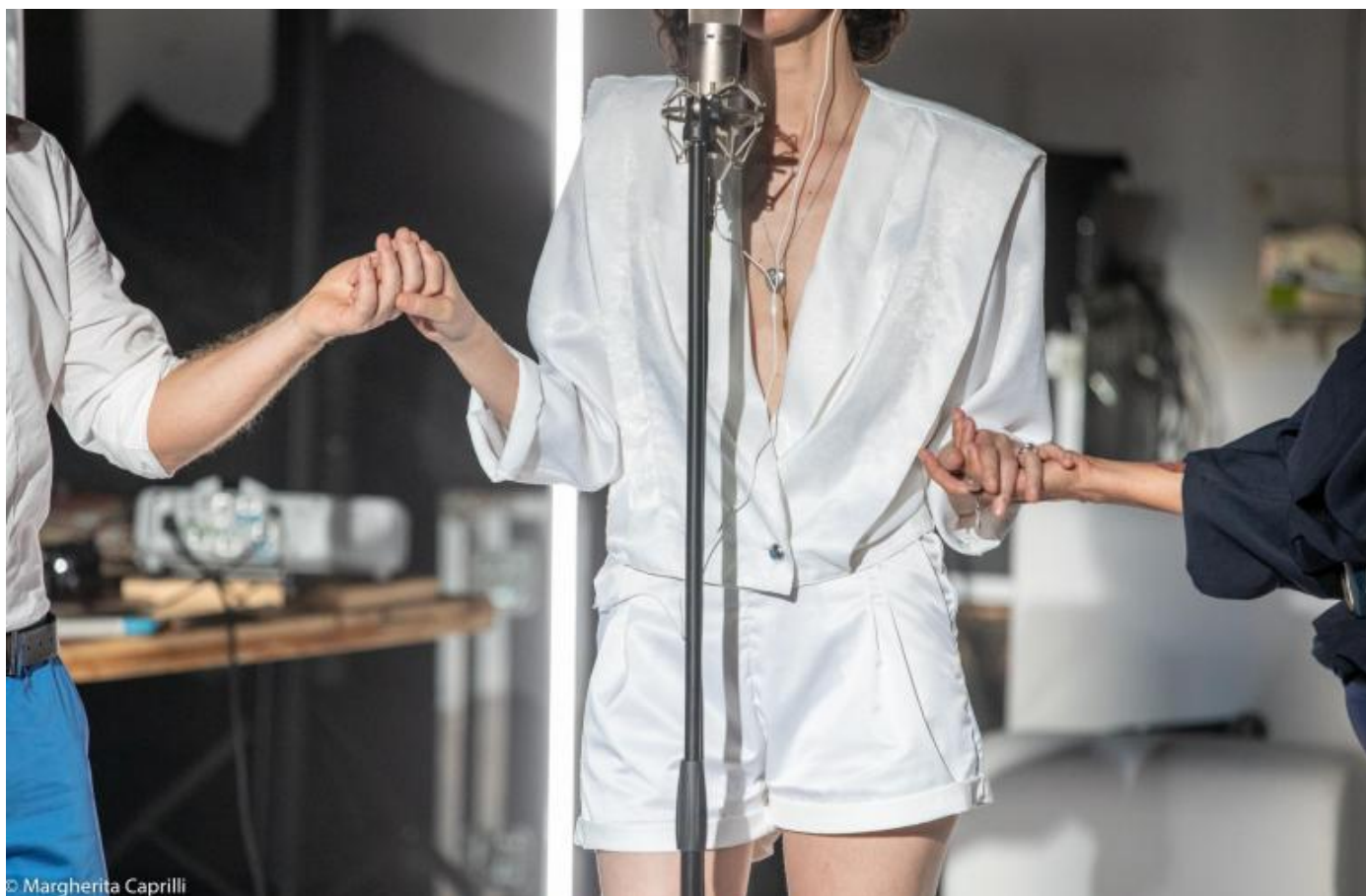
La mappa del cuore, Ateliersi