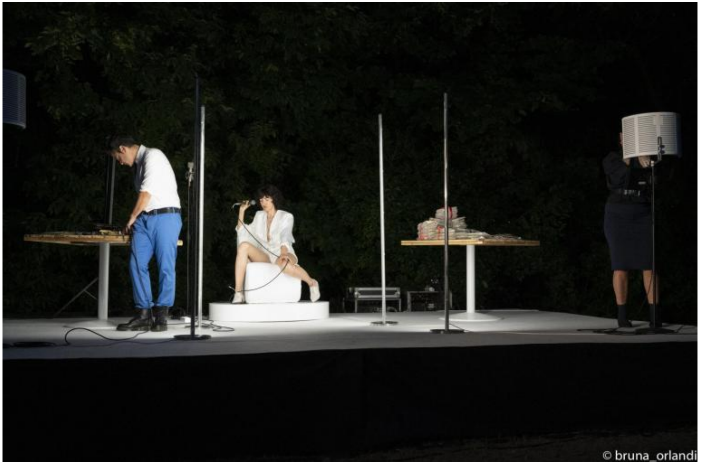
La mappa del cuore, Ateliersi.

alzasse il volume, diventano tutte le voci: quella di un'adolescente che leggeva "Ragazza In"; quella di un ragazzino la cui madre leggeva "Ragazza In"; quella di tutte le lettere, di quelle buste, di quegli indirizzi e nick name: Lacrima nera, Leonessa '66, Patty, Sognatrice, Una drogata.