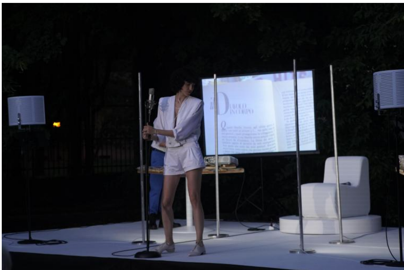
La mappa del cuore, Ateliersi.

E avendo i corpi, i grandi assenti da tanta parte del discorso culturale. E da qui mi pare che non posso non domandarvi della presenza in scena di Francesca.